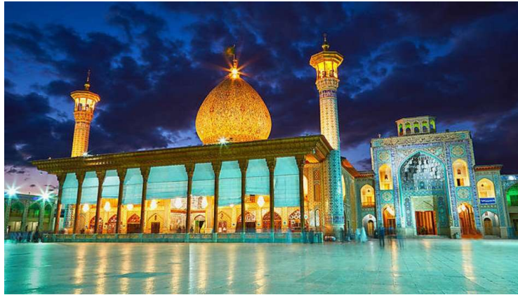
شکل ۱. مرقد مطهر احمد بن موسی، شاه‌چراغ (ع)

(علیه‌السلام) و برادر امام رضا (علیه‌السلام) است. ایشان در زمان خلافت مأمون بین سال‌های ۱۹۸ تا ۲۰۳ ه.ق با جمعی از نزدیکان و محبان اهل‌بیت از مدینه به‌سوی طوس حرکت کرد و در این مسیر در نزدیک شیراز در جنگ با نیروهای حکومت در محل بارگاه، به شهادت رسید (محب‌زاده و طاهری، ۱۳۹۷).